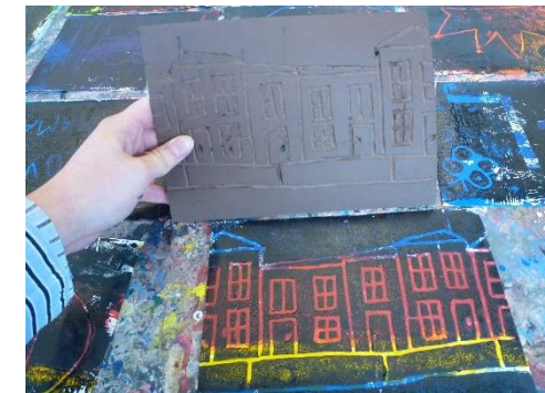
Aus dem Workshop „Erst gucken, dann drucken!“ (2018)

Eine Kuh geht im Haus spazieren, am Himmel tauchen Spiralen und Muster auf und eine Pendeluhr geht baden: Wo bin ich hier gelandet? Willkommen in den Bildern von Franz Radziwill! Der Künstler unserer aktuellen Ausstellung nimmt uns in seinen kulissenhaften Bildern auf eine Reise voller Abenteuer und Geheimnisse mit. Wir folgen ihm mit Farben, Tusche und Fotos aus Zeitschriften und fangen so ein eigenes surreales Bild ein.