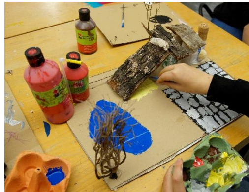
Entstanden im offenen Workshop am XXL-Kulturtag 2018