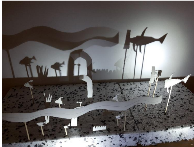
Aus dem Workshop „Schatten an der Wand“ (2018)

Führungen für Kindergärten und Schulklassen sind nach telefonischer Vereinbarung und auch außerhalb der Öffnungszeiten möglich. Für Kinder und Jugendliche aus der Verwaltungsgemeinschaft Bietigheim-Bissingen, Ingersheim und Tamm sind diese Führungen kostenlos!