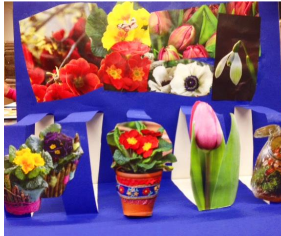
Aus dem Workshop „Bau dir deine eigene Welt“, 2016 Titelmotiv: Entstanden im Workshop „Architektur spricht“, 2016

Führungen für Kindergärten und Schulklassen sind nach telefonischer Vereinbarung und auch außerhalb der Öffnungszeiten möglich. Für Kinder und Jugendliche aus der Verwaltungsgemeinschaft Bietigheim-Bissingen, Ingersheim und Tamm sind diese Führungen kostenlos!