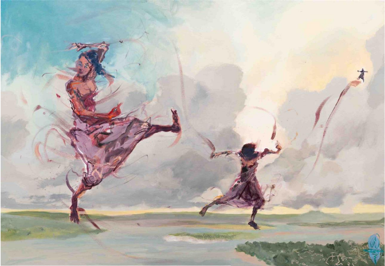
Saut de l'Être #25, 2023, Acryl, Ölkreide auf Leinwand © VG Bild-Kunst, Bonn 2025