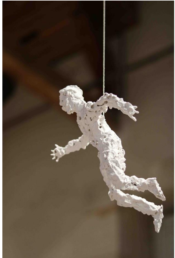
Saut de l'Étre, 2022 Draht und Gips © VG Bild-Kunst, Bonn 2025