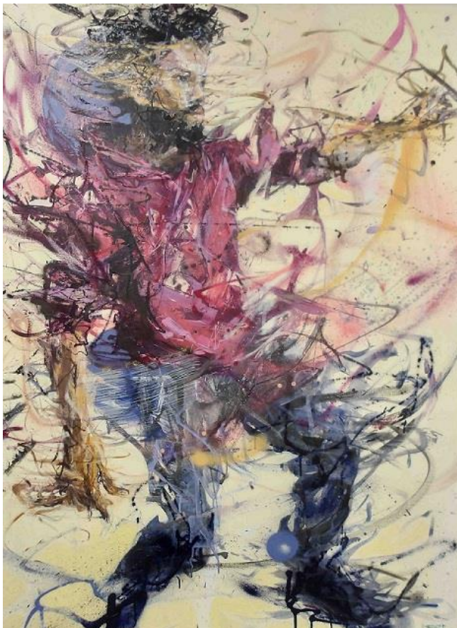
Homomotus, FE 26 #6, 2020 Acryl, Ölkreide auf Leinwand © VG Bild-Kunst, Bonn 2025