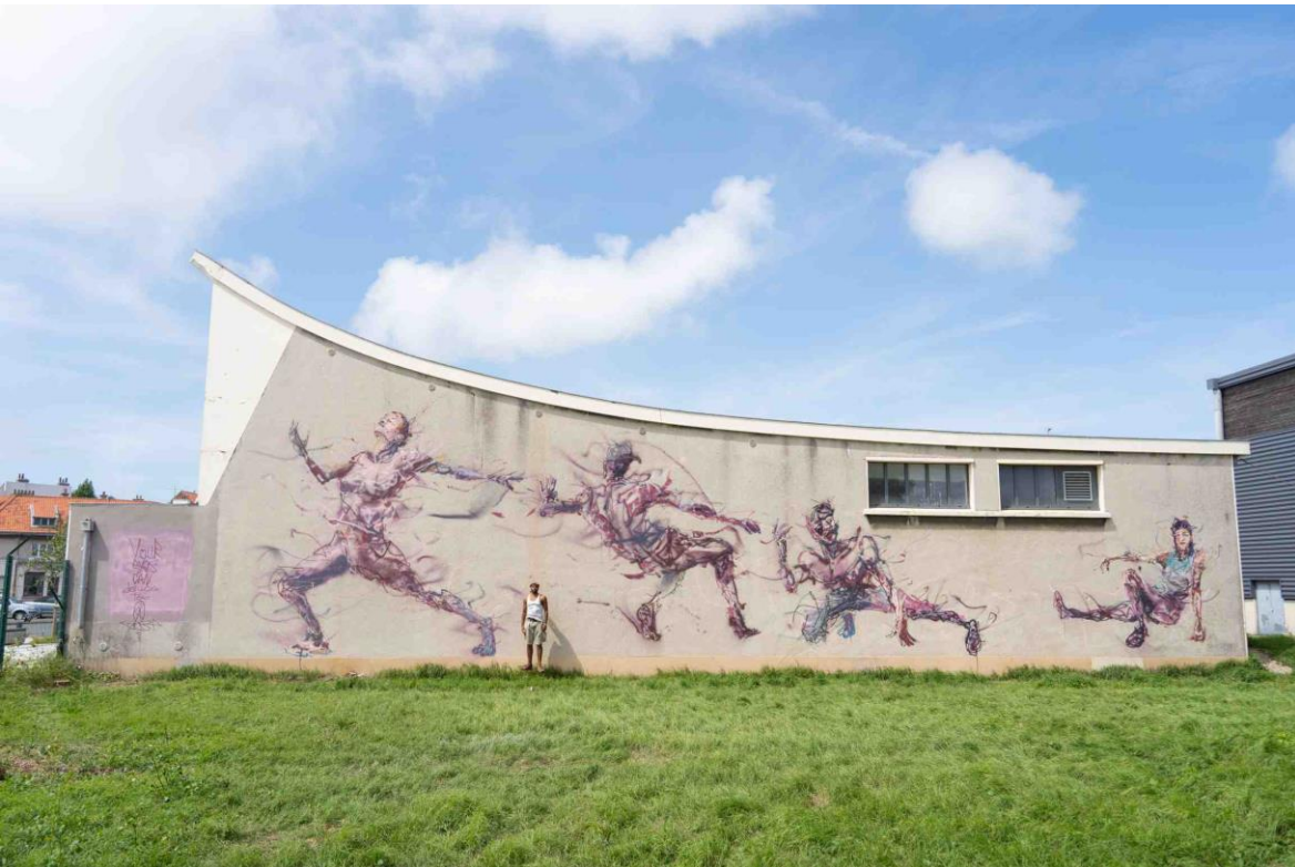
Homomotus tribu #2, Calais Street Art Festival, BCMO-Gebäude (ballet contemporain des mers d'opale), Calais, Frankreich, 2023

Eine Auswahl an realisierten Wandmalereien ist in der Ausstellung auf einem Bildschirm erlebbar!