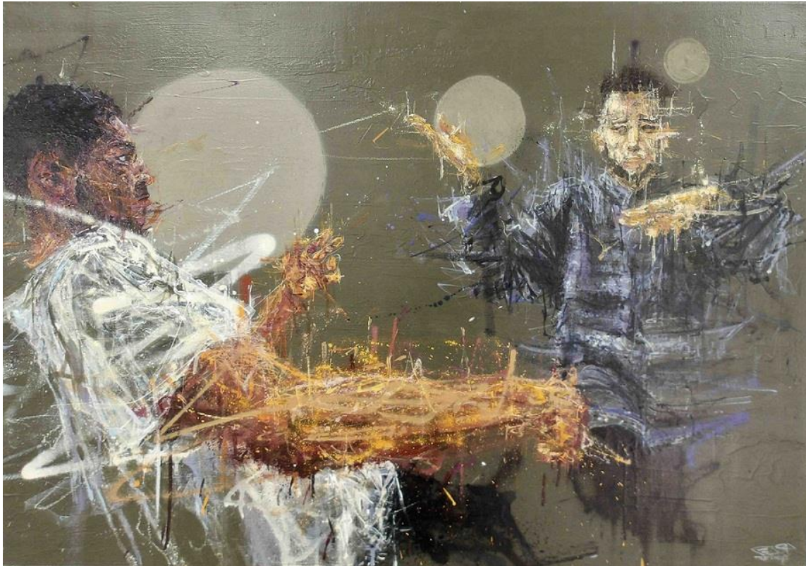
Oppoze Yin #3, 2018, Acryl, Spray, Tinte auf Leinwand © VG Bild-Kunst, Bonn 2025