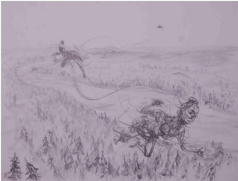
Saut de l'Étre, Skizze 1, 2022, Bleistift © VG Bild-Kunst, Bonn 2025