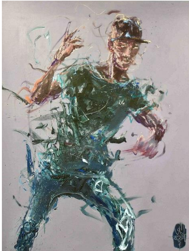
Homomotus #6, 2021 Acryl, Ölkreide auf Leinwand © VG Bild-Kunst, Bonn 2025