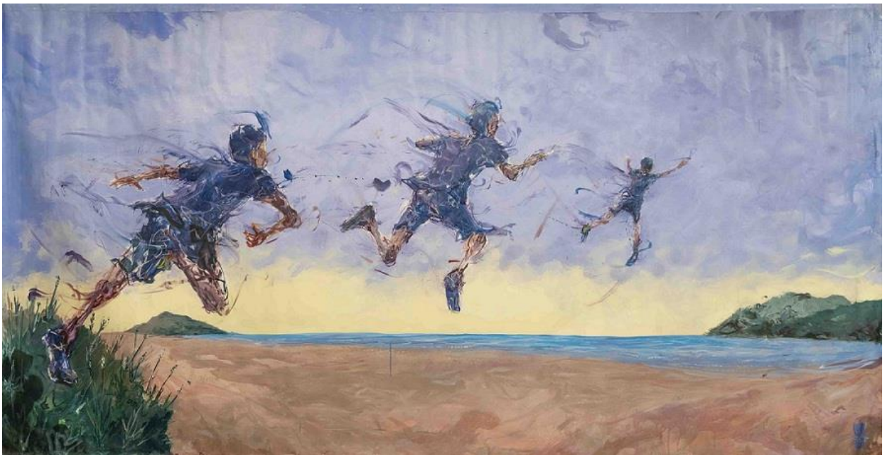
Saut de l'Être #12, 2022, Acryl, Ölkreide auf Leinwand © VG Bild-Kunst, Bonn 2025