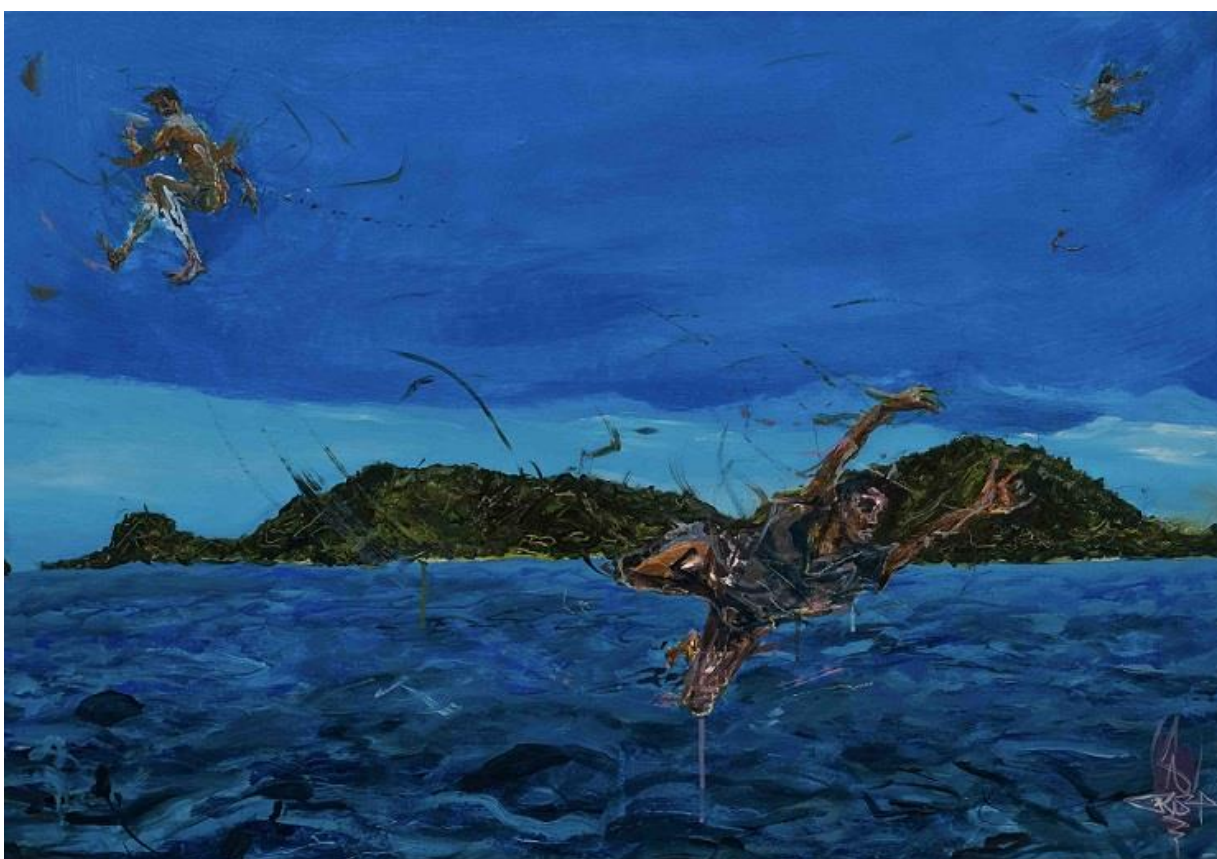
Saut de l'Être #21, RIMBA, 2023, Acryl, Ölkreide auf Leinwand © VG Bild-Kunst, Bonn 2025