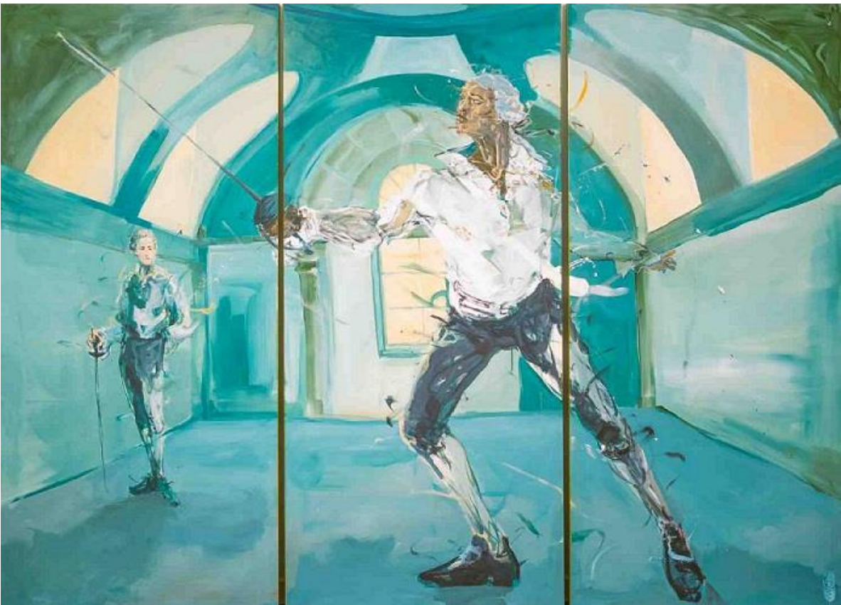
La Salle du Temps, aus der Serie: Joseph De Bologne or the Knight of Saint-Georges, 2024, Acryl, Ölkreide auf Leinwand © VG Bild-Kunst, Bonn 2025