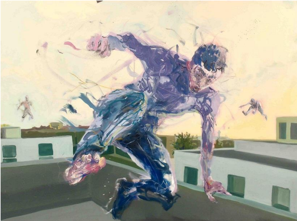
Corps en Ciel, 2024, Acryl, Ölkreide auf Leinwand © VG Bild-Kunst, Bonn 2025