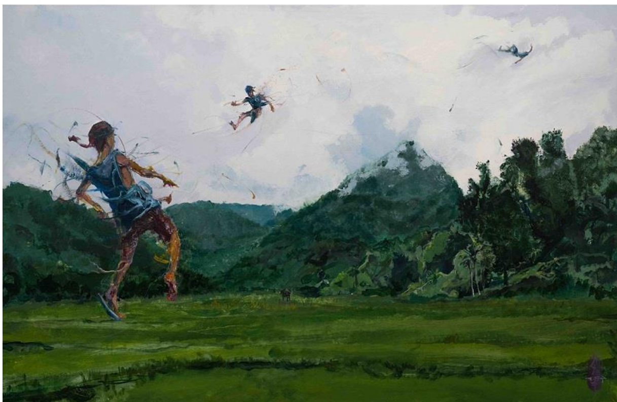
Saut de l'Être #19, RIMBA, 2023, Acryl, Ölkreide auf Leinwand © VG Bild-Kunst, Bonn 2025