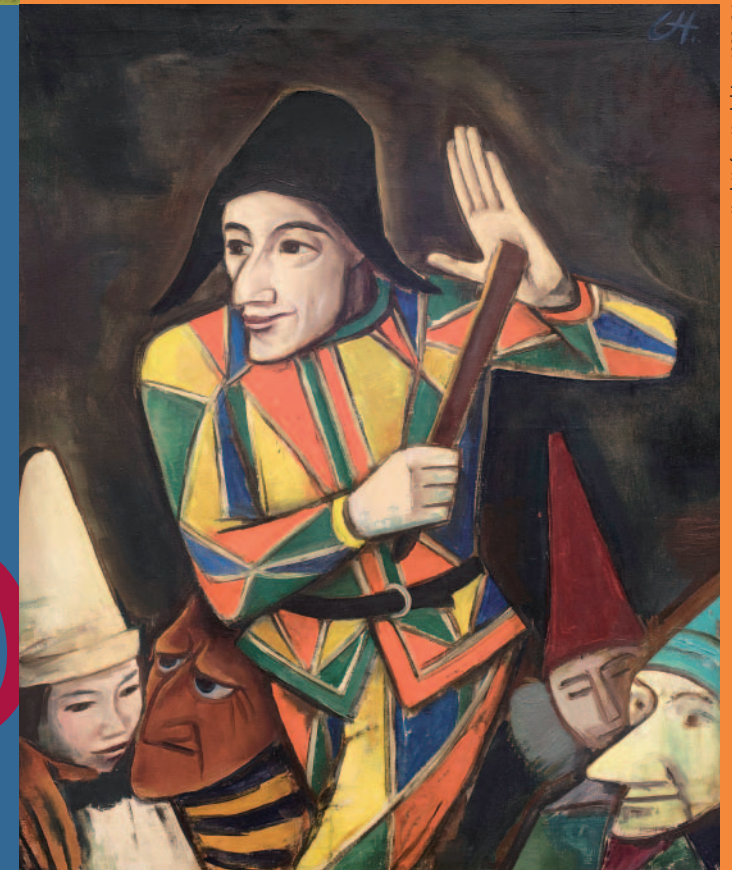
Karl Hofer, Harlekine, 1923-24

Karl Hofer (1878–1955) gehört zu den bedeutendsten Malern der Moderne in Deutschland. Auf der Suche nach einer menschlichen Wahrheit jenseits politischer und modischer Strömungen entwickelte Hofer eine eigenständige Bildsprache zwischen Expressionismus, Neuer Sachlichkeit und Magischem Realismus – geprägt von eindringlicher Emotionalität, stiller Dramatik und hohem Symbolgehalt. Im Mittelpunkt steht dabei eindeutig die Darstellung des Menschen, doch schuf Hofer auch Landschaften und Stillleben. Sein Werk spiegelt seinen von Höhen und Tiefen geprägten Lebensweg ebenso wie seine persönliche Zerrissenheit. Als Direktor der Hochschule für bildende Künste in Berlin prägte er maßgeblich die Nachkriegsdebatte um Figuration und Abstraktion. Die Ausstellung gibt einen umfassenden Überblick über Hofers Schaffen mit rund 80 Gemälden, entstanden zwischen 1900 und 1955.