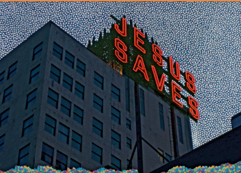
Miguel Rothchild, Jesus Saves, 2010

Für die Mehrzahl der Weltbevölkerung bestimmt Religion die Identität und alltäglichen Lebensrhythmen. Auch die Kultur, Denkweisen und Moralvorstellungen des globalen Nordens waren jahrhundertlang von Religion geprägt – und sind es in unterschiedlicher Intensität noch immer. Viele Bildformeln und Rituale sind für uns in Mitteleuropa so selbstverständlich, dass wir diese kulturelle Prägung kaum noch wahrnehmen. Die Ausstellung zeigt aktuelle künstlerische Positionen, die der eigenen religiösen Fundierung nachspüren oder sich mit dem Interreligiösen beschäftigen. Die Künstler*innen kommen aus vielen Ländern, sind christlich, jüdisch, muslimisch, agnostisch oder atheistisch aufgewachsen – manche sind gläubig, andere haben eine kritische Distanz zur Religion. Die Ausstellung lädt die Besucher*innen zum Dialog ein und eröffnet die Möglichkeit, auf ungewöhnliche und vielleicht unerwartete Weise in die Sphären der Religion einzutauchen.