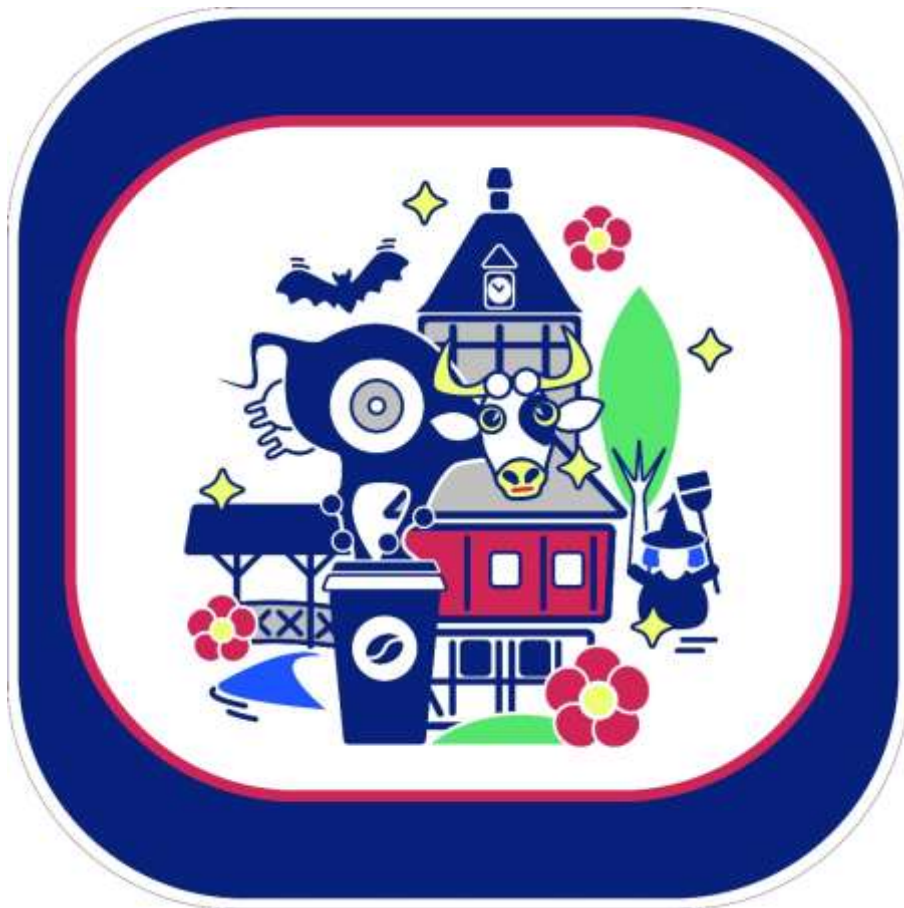
Altstadt, Piktogramm und Zeichnungen