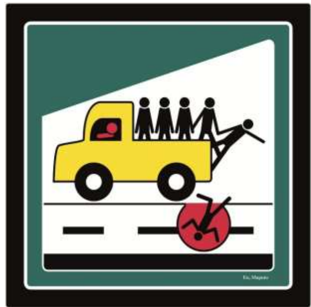
CityX – Eu, Maputo – My Love, 2018/19

Das erste CityX-Projekt in Afrika Eu, Maputo fand 2018/19 in Maputo, der Hauptstadt von Mosambik statt. Viele Bewohner*innen zeichneten die Vielschichtigkeit der Stadt, welche auch in den Piktogrammen gespiegelt wird: die urbane Stadt, die Flagge des Landes oder die Korruption wurden festgehalten.