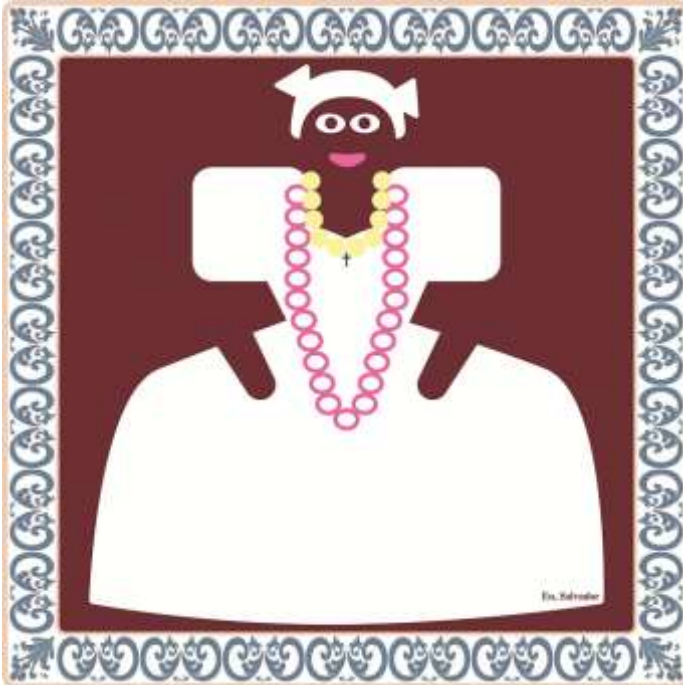
CityX – Eu, Salvador – Bahiana, 2016/17

Das 2016/17 entwickelte CityX-Projekt Eu, Salvador zeugt von den Widersprüchen innerhalb der brasilianischen Bevölkerung: dem Stolz für ihre Kultur, aber auch die Konflikte innerhalb der Gesellschaft.