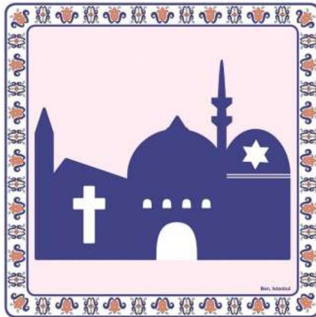
CityX – Ben, Istanbul – Appreciation, 2014/15

Das CityX-Projekt Ben, Istanbul fand 2014/15 statt und bezog sich oftmals auf die Dualität der türkischen Stadt: Sowohl die beiden Kontinente Europa und Asien, als auch die Gegensätze und Gemeinsamkeiten von Christentum und Islam werden in den Piktogrammen deutlich. Denn vor allem die Religion war im 16-teiligen Stadtbild ein wichtiges, verbindendes Element.