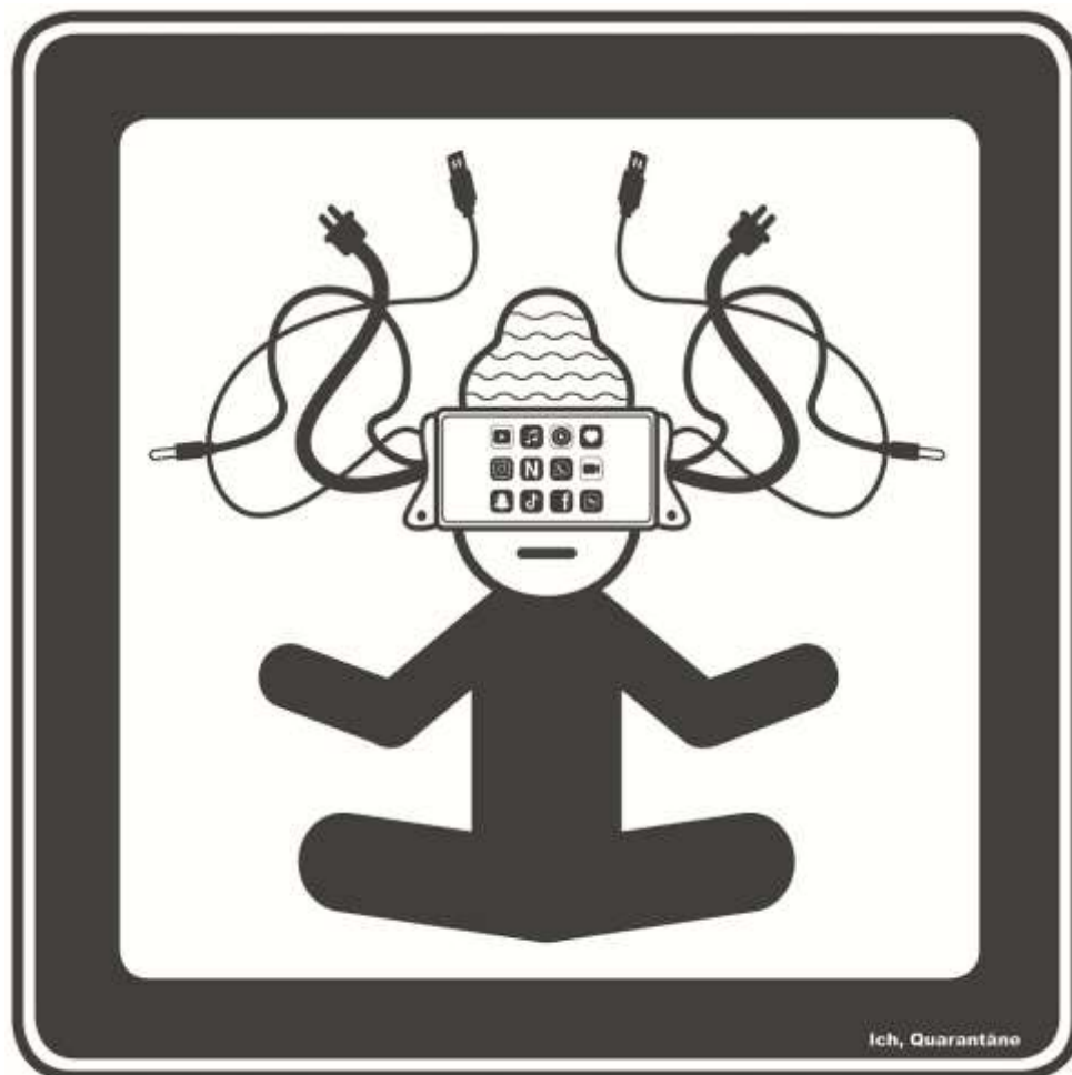
Ich, Quarantäne – Fenster zur Welt, 2020/21

Nachdem es bei dem Langzeitprojekt CityX um die Beziehung der Bevölkerung zu ihrer Stadt geht, stellte Doris Graf bei dem Projekt Ich, Quarantäne den momentanen Zustand der Menschen während der Corona-Pandemie bildnerisch dar. Dazu wählte sie auch hier eindrückliche Piktogramme als Mittel ihres künstlerischen Ausdrucks.