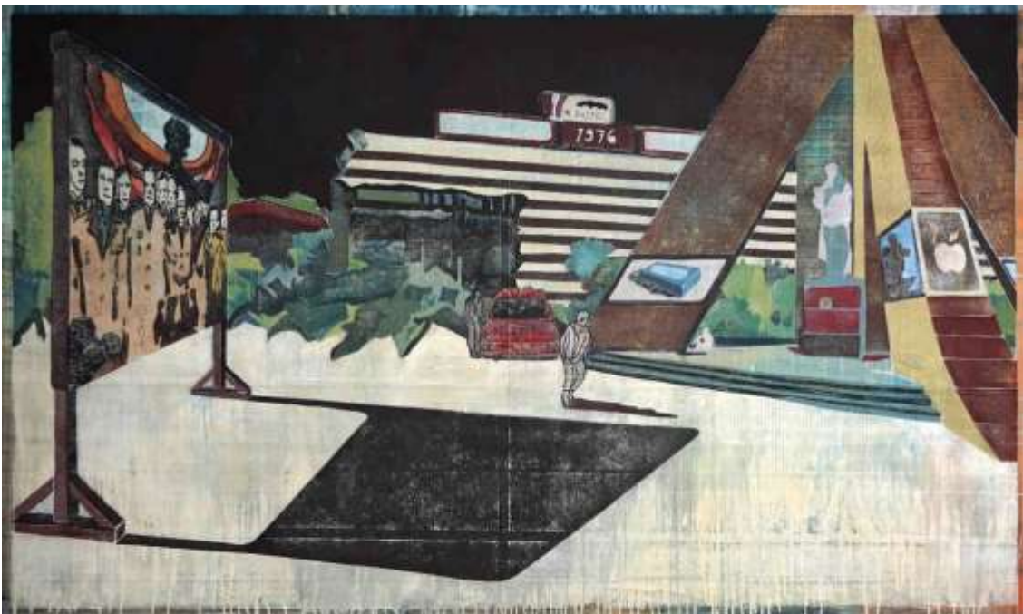
1. Preisträger: Sergei Moser, 1976, 2024

Die Vielfalt der ausgewählten Kunstwerke reicht von klassischen Schwarz- und Weißlinienschnitten bis zu vielfarbigen Linolgemälden, von einer keramischen Arbeit bis zu einem Guckkasten mit bewegten und beleuchteten Linolschnittfolien, von handgefertigten Künstlerbüchern bis zu einem Trickfilm, für welchen Linolschnitte animiert wurden. Eine überaus abwechslungsreiche Ausstellung, die verblüfft und begeistert!