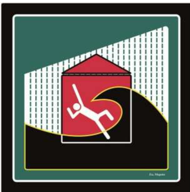
CityX – Eu, Maputo – Temporary Living, 2018/19