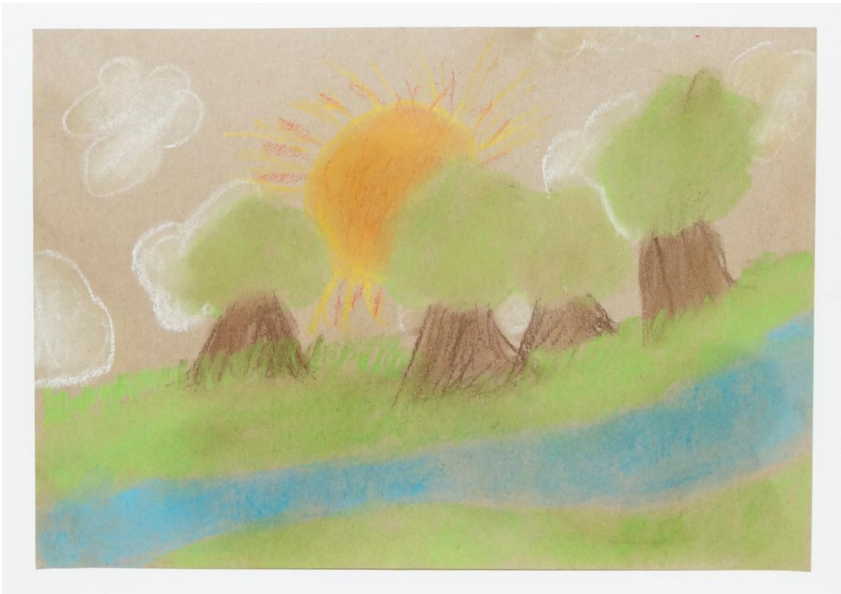
Abb.: Entstanden in einem unserer Workshops für Kinder

Im Praxisteil setzen sich die Kinder mit ihrer eigenen Vorstellung vom Paradies auseinander. Dabei sind der Kreativität keine Grenzen gesetzt: Von Kreiden und Stiften bis hin zu Schwämmen oder Pinseln stehen den Kindern verschiedenste Materialien und Möglichkeiten zur Verfügung, um ihre Ideen künstlerisch umzusetzen.