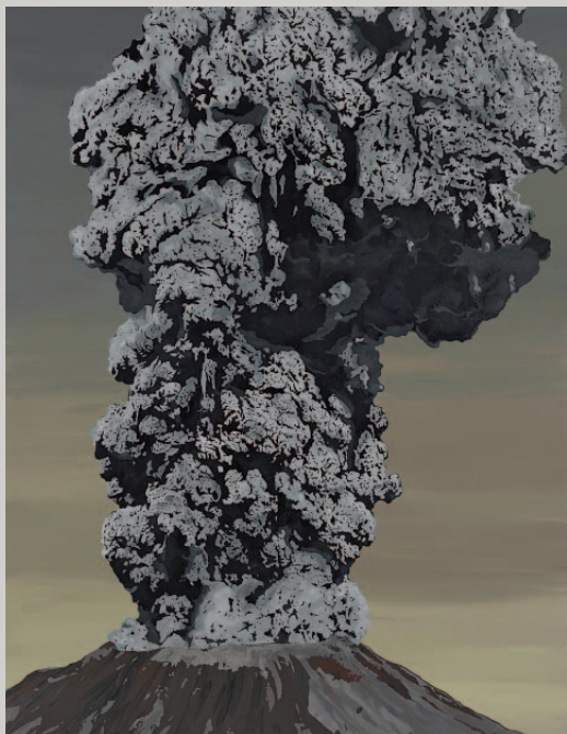
Sven Drühl, SDNN (volcano), 2016, Kunsthalle Emden

Öffentliche Führungen jeden Sonntag, 11.30 Uhr