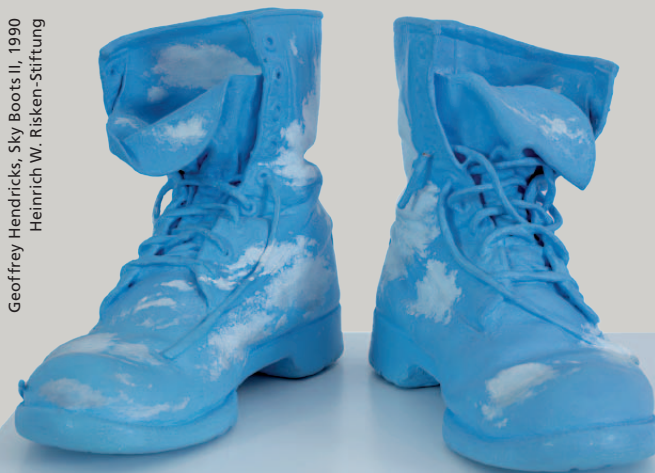
Geoffrey Hendricks, Sky Boots II, 1990 Heinrich W. Risken-Stiftung

Wolken und deren Spiel am Himmel faszinieren die Menschen seit jeher. Und so haben diese Ansammlungen von Dunst in der Luft stets auch Künstler*innen zu beeindruckenden Werken angeregt. In der Renaissance und im Barock kamen Wolken vornehmlich als Sinnbild des Göttlichen zum Einsatz, während sie in der Romantik und im Impressionismus als eigenständiges Element ins Zentrum der atmosphärischen Landschaftsmalerei rückten. Der Expressionismus wiederum setzte die Dramatik des Himmels mit eigenen ausdrucksstarken Mitteln fort. In der Malerei wie in der Fotografie können Wolken aber auch Anlass bieten, das bildnerische Abstraktionspotential zu erkunden.