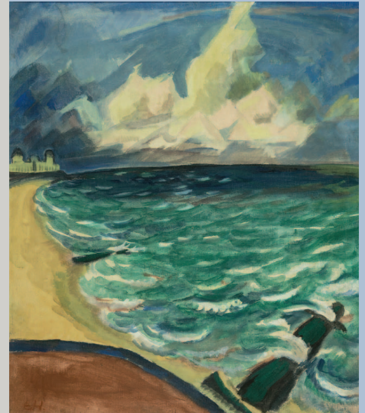
Erich Heckel, Aufsteigende Wolke, 1916 Sammlung Kunsthau NRW Kornelimünster