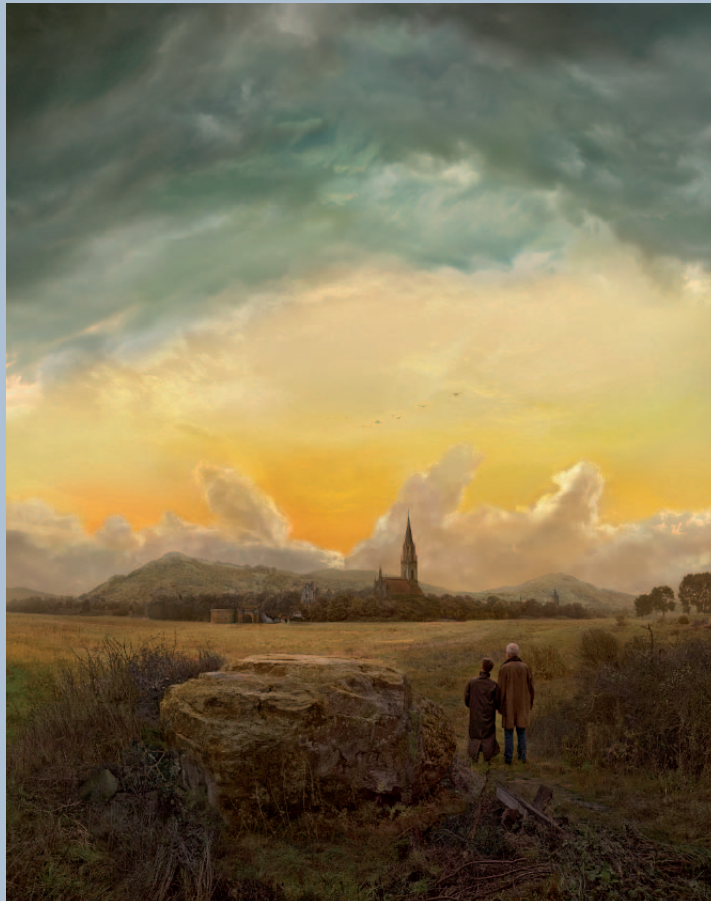
Hiroyuki Masuyama, After C.D. Friedrich, Neubrandenburg 1816/17, No. 03, 2022